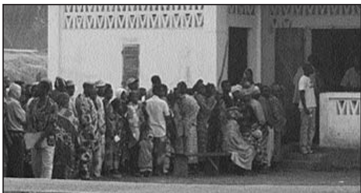
People lined up for clinic visit

The mission to Bénin was made possible through grants received from Canada's Department of Foreign Affairs and Montfort Hospital. Contributions were also gratefully accepted from pharmaceutical companies, doctors, individual donors and institutions that gave medication and donations. On behalf of the communities of Aklampa and Anoum, the Bénin team sincerely thanks you.