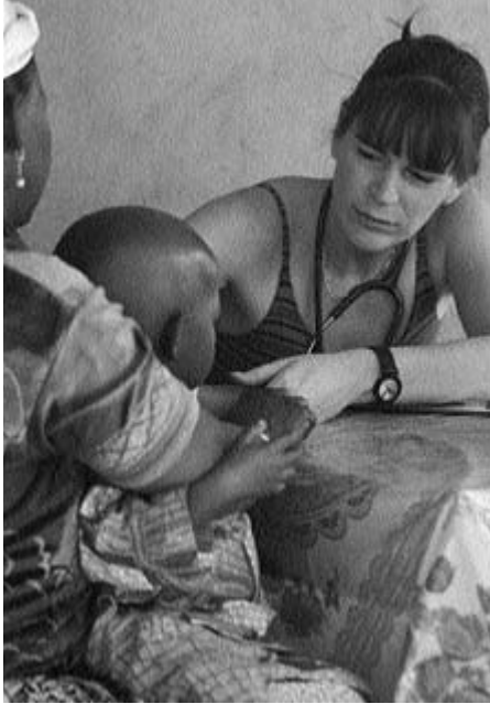
Mother and child receiving check-up