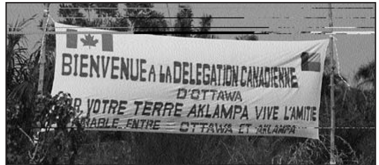
Welcoming the CACHA Medical Team

L'Alliance en était à sa deuxième mission à Aklampa et l'arrivée des Canadiens a été l'occasion d'une grande fête. Les élèves de l'école primaire, qui bénéficiaient d'une demi-journée de congé, formaient une haie d'honneur pour accueillir l'équipe. Sur la place publique, au son des tam-tams, on a fait danser les masques et des acrobates sur des échasses; par la suite, plusieurs dignitaires, en présence des anciens du village, ont fait des discours de bienvenue. Chaque membre de l'équipe a alors été fait citoyen hono-